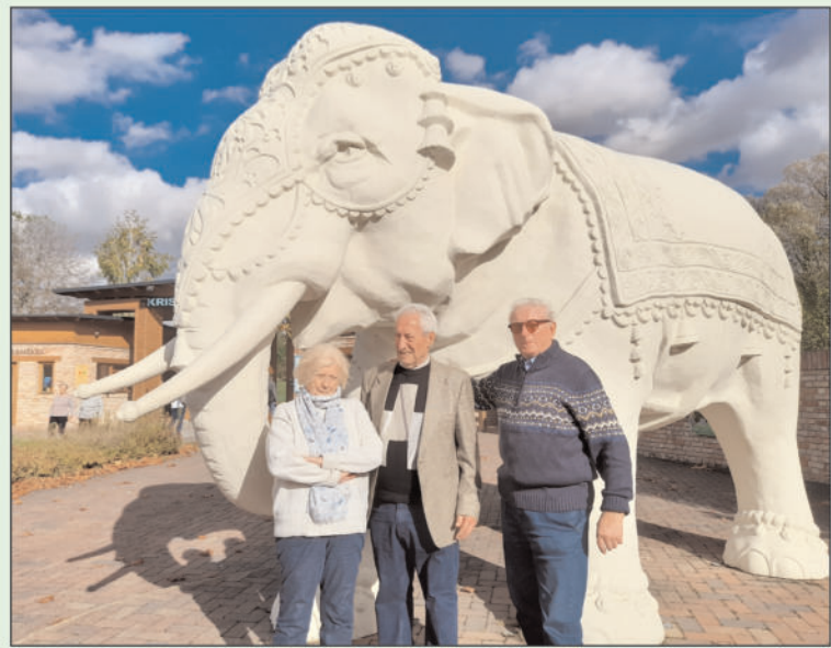
Október 26-án felkerestük a Krisna-völgy Indiai Kulturális Központot és Biofarmot