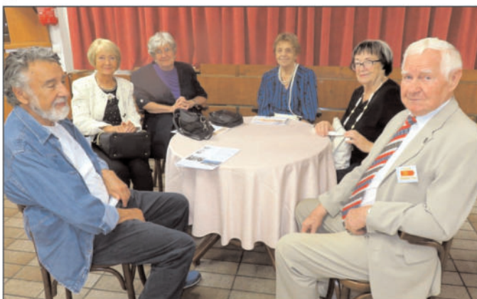
Szombathelyi Ferenc ny. vezérőrnagy, egykori honvédelmi miniszterhelyettes (jobbról) nyitotta meg a jubileumi ünnepséget

alapműveltséget adó képzésben vettünk részt, melyet minden olyan kulturális, sport vagy bármilyen tudás és gyakorlat elsajátítása is gazdagított, amelyek a növendékek egyéni érdeklődését is kitűnően kielégítették.