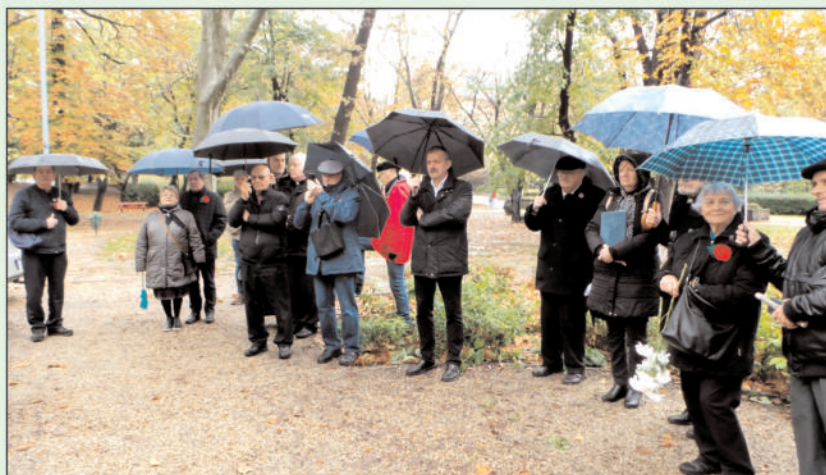
Esett az eső, mégis szép számmal vettünk részt november 11-én az I. világháborút lezáró fegyverszüneti egyezmény aláírása alkalmából rendezett hagyományos gyertyagyújtáson a Városmajorban