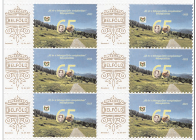
A 65. évfordulóra is készült emlékvét

A négynapos nyitvatartás alatt több mint százan látták a bemutatott anyagokat.