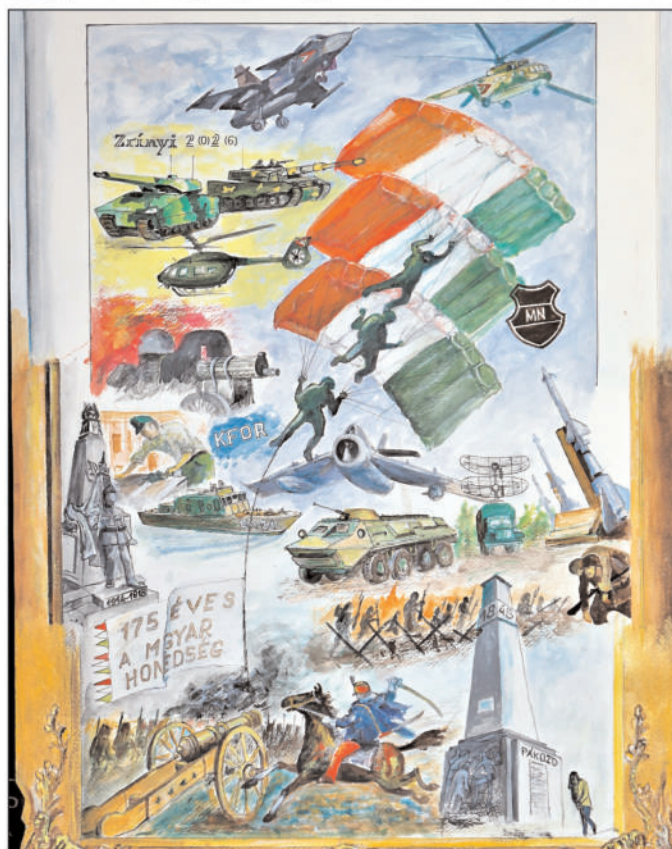
A rézágyútól a Gripenig

A festészet és a már említett kertbarát-tevékenység mellett nagy kedvvel fotózok. Ennek során idén első díjat nyertem a Kertészek és Kertbarátok Országos Szövetségének fotópályázatán a „Szenderlepke, a magyar kolibri” c. felvételemmel.