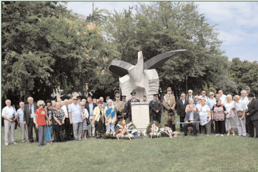
Augusztus 16-án a Tiszta Égbolt BE a Repülő és légvédelmi tagozattal közösen, az Őrs vezér téren megemlékezett a katonai repülés hőseiről