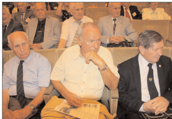
A Rákóczistákon kívül sok érdeklődő is jelen volt