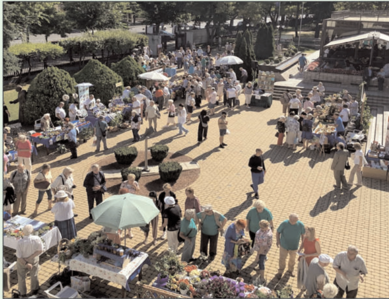
Szeptember 20-án a BPNYKLUB Kertbarát tagozata megrendezte hagyományos terménykiállítását