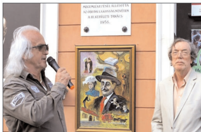
Koszorúzási ünnepségen a Krúdy Gyuláról készült portrémmal

Festegetek, feleségemmel szépítgetjük a lakásunkat, nyaralónkat, utazgatunk... Na és ott vannak az unokák!