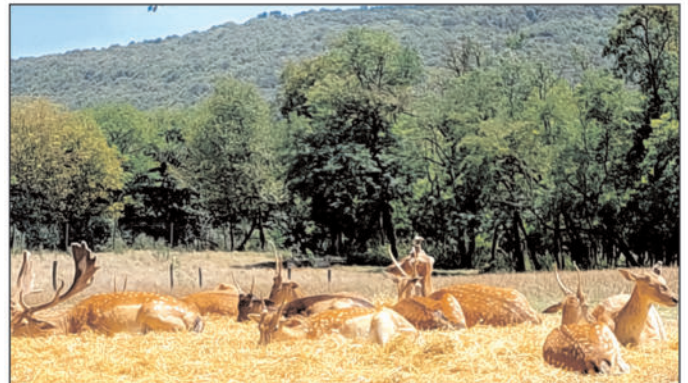
Pihenő jávorszarvasok Zselicben